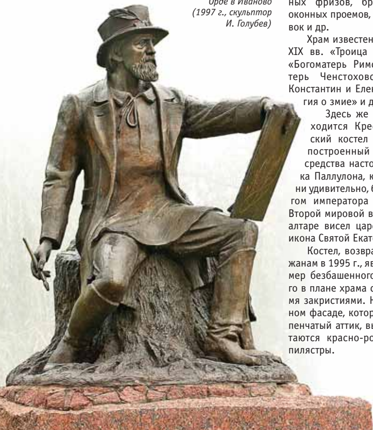
Памятник Наполеону Орде в Иваново (1997 г., скульптор И. Голубев)

доходя до Волги и Кавказа. Они даже изобрели свой тайный язык... «Яновец» и «лаборь» стали словами-синонимами.