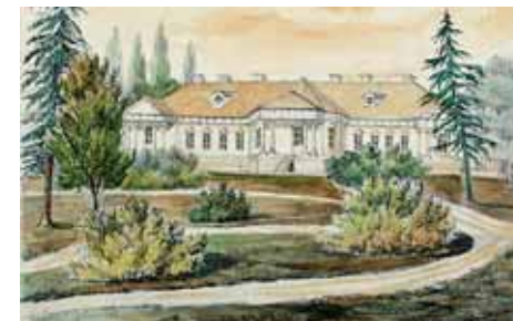
Молодово, 1864 г., дворец Скимунтов.