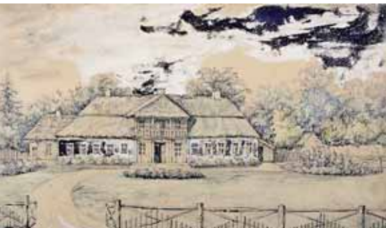
Вороцевичи 14 августа 1860 г. Рис. Н. Орды