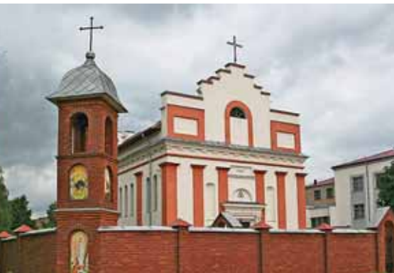
Костел Воздвижения Святого Креста (1848)

сложилась традиция – заниматься сбором добровольных пожертвований на храмы. В XIX в. яновские лабори разбредались по европейской части Российской империи,