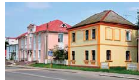
Рядовая застройка начала XX века на ул. Ленина в Иваново