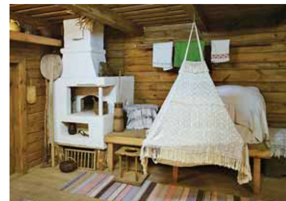
Мотольский музей народного творчества

А вот деревянная церковь Параскевы Пятницы, построенная как костел во второй половине XVIII в. еще при Огинских, уцелела. Перед войной она имела на