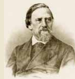
Художник и композитор Наполеон Орда (1807 – 1883)

Сведения о местечке Янов (Яново) довольно скупы. Им владели князья Шуйские, влиятельные Ожешки, здесь были земли Дмуховских и Куженецких... Давным-давно у здешнего населения