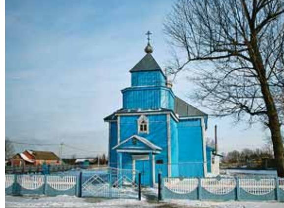
Свято-Вознесенская церковь в Молодово (XVIII в.)

Заглянув сюда, в живописный уголок Полесья у самой границы с Украиной, можно сделать несколько открытий. В 1792 г. в Мохро была построена сохранившаяся до наших дней Свято-Петро-Павловская церковь, являющая собой оригинальный пример воплощения в деревянном зодчестве приемов каменного строительства в стиле барокко. В интерьере святыни находятся иконы XVIII-XIX вв.