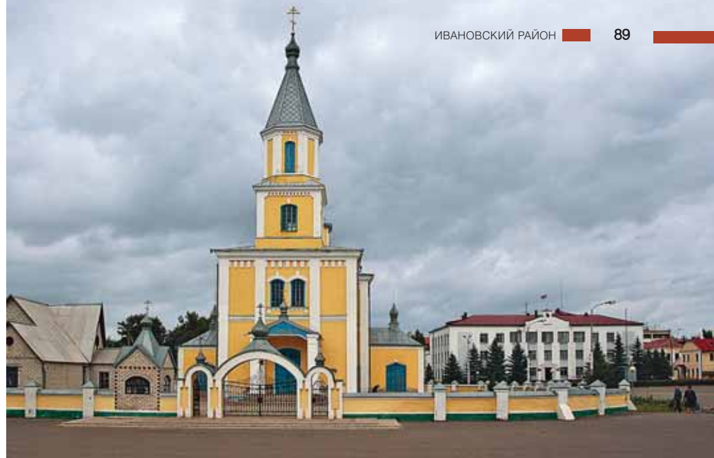
Церковь Покрова Пресвятой Богородицы

Костел, возвращенный прихожанам в 1995 г., являет собой пример безбашенного прямоугольного в плане храма с апсидой и двумя закрестиями. На светлом главном фасаде, который венчает ступенчатый аттик, выразительно читаются красно-розового оттенка пилястры.