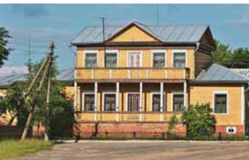
Мотольский музей «Млын»