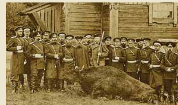
Императорская охота в Беловежской пуще (1894)

Поскольку через Каменец шла важная дорога из Кракова на Вильню, в здешнем замке бывали послы из Европы, Новгорода, Пскова; в 1409 г. легат Папы Римского Александра V встречался здесь с польским королем Владиславом II Ягайло; сюда же на встречу с великим князем литовским Витовтом приезжал в 1421 г. посол английского короля Генриха V Жильбер де Ланнуа. В 1526 г. о городе «с каменной башней в деревянном замке» упоминает