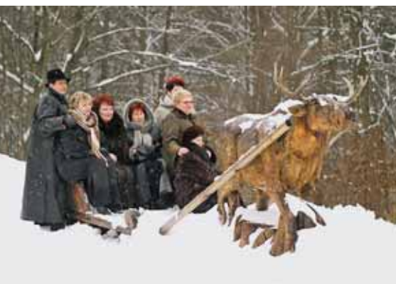
Поместье белорусского Деда Мороза

нообразия Беловежской пущи сделали ее всемирно известным природным объектом.