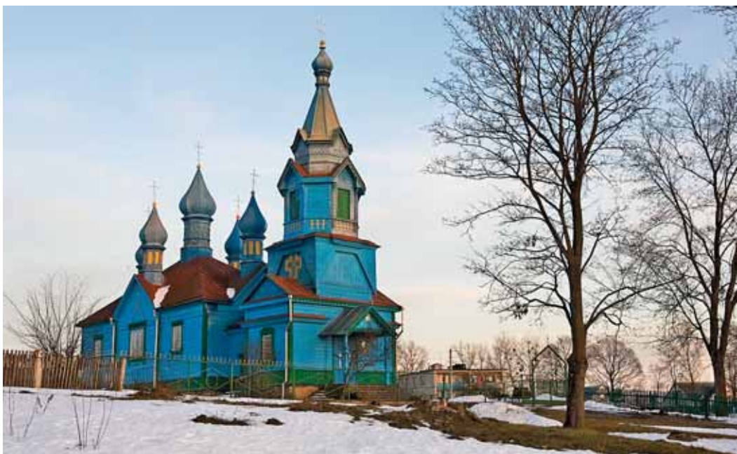
Церковь Св. Параскевы Пятницы, д. Николаево