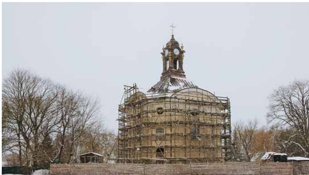
Волчин, Троицкий костел

Солтанов. Через цепочку браков и продаж Волчин в 1720 г. достался подканцлеру ВКЛ князю Казимиру Чарторыйскому. В том же году дочь Казимира, Констанция, сочеталась браком с 44-летним генералом графом Станиславом Понятовским, особо отличившимся во время Северной войны в сражениях на стороне шведского короля Карла XII, которому он дважды спасал жизнь. Осев в Волчине и значительно расширив свои владения, Станислав,