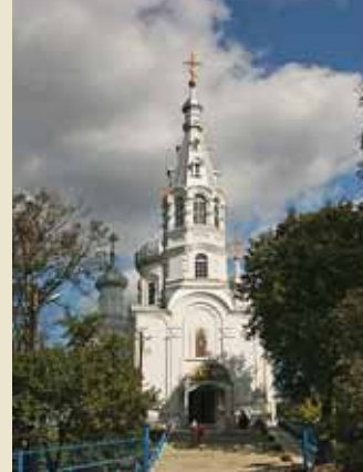
Свято-Симеоновская церковь в Каменце (1914)

Укрепляя северную границу Берестейской земли, владимирово-волинский князь Владимир Васильевич в 1276 г.