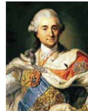
Станислав Август Понятовский

Солтанов. Через цепочку браков и продаж Волчин в 1720 г. достался подканцлеру ВКЛ князю Казимиру Чарторыйскому. В том же году дочь Казимира, Констанция, сочеталась браком с 44-летним генералом графом Станиславом Понятовским, особо отличившимся во время Северной войны в сражениях на стороне шведского короля Карла XII, которому он дважды спасал жизнь. Осев в Волчине и значительно расширив свои владения, Станислав,