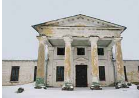
Руины бывшей резиденции Сапег и Потоцких в Высоком

Стоит заглянуть в хронику Высокого – и руками всплеснешь: кто тут только ни отметился в разные времена! Хрептовичи, Сапег, Огинские, Потоцкие... После них в Высоком остались культурно-исторические пласты двух эпох.