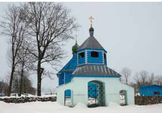
Церковь Св. Троицы, д. Войская

Церковь Св. Онуфрия (1840) и колокольня при ней выглядят скромно и достойно. Бутовая кладка, «отретушированная» белой штукатуркой дверного и оконных проемов, лопаток и углов здания, к тому же обработанных рустом, – так проявил себя здесь поздний классицизм.