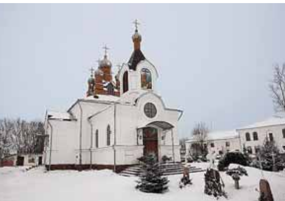
Церковь Воздвижения Креста Господня, г. Высокое

Классицизм в Высоком дает о себе знать дворцово-парковым ансамблем, созданным по инициативе Пелагеи Сапеги, урожденной Потоцкой. В первом браке она была замужем за Франтишком Сапегой, во втором – за Павлом Сапегой. Покинув неверного мужа и его дворец в Деречине под Зельвой, эта «деречинская Терпсихора» (в образе греческой музы танца ее запечатлела на своем портрете знаменитая художница Элизабет Виги-Лебрун) переехала сюда. Дворец с флигелями и пейзажный парк формировался усилиями Пелагеи и ее наследников. Гармония ландшафтов, как изначальных, природных, так и созданных усилиями садовников, позволяет го-