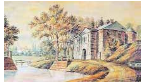
Брама замка Сапег в Высоко-Литовске, рис. Н. Орды (1876)