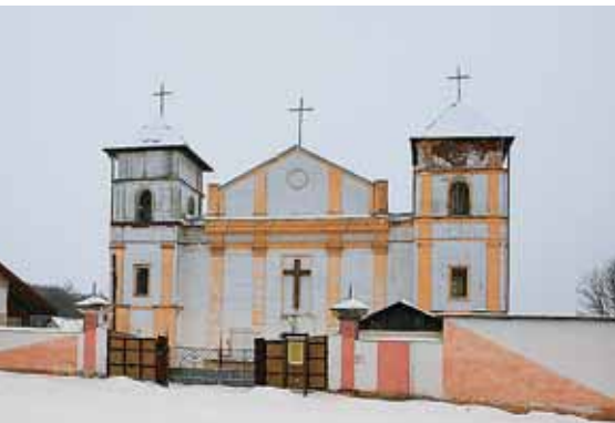
Костел Святой Троицы, г. Высокое